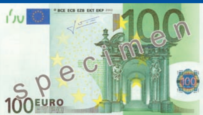
147 x 82 mm, roheline