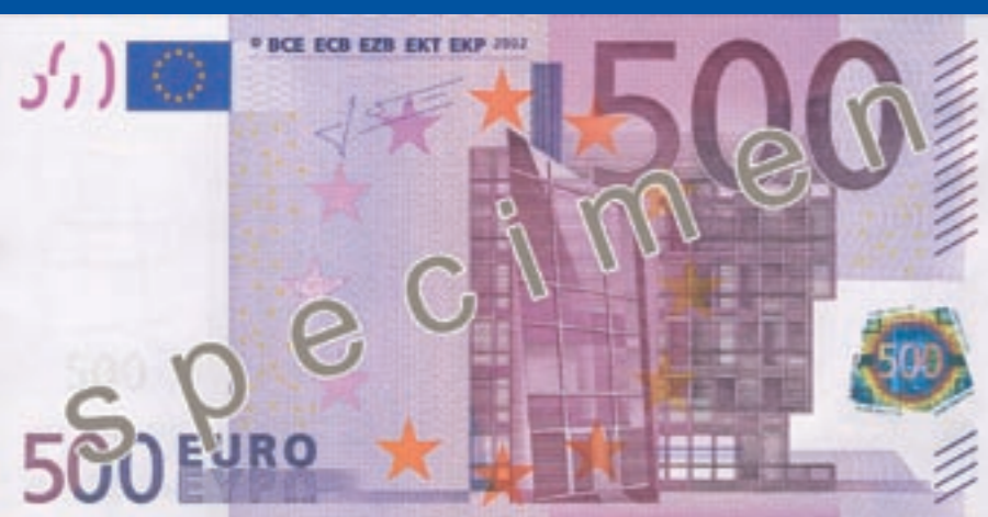
160 x 82 mm, lilla