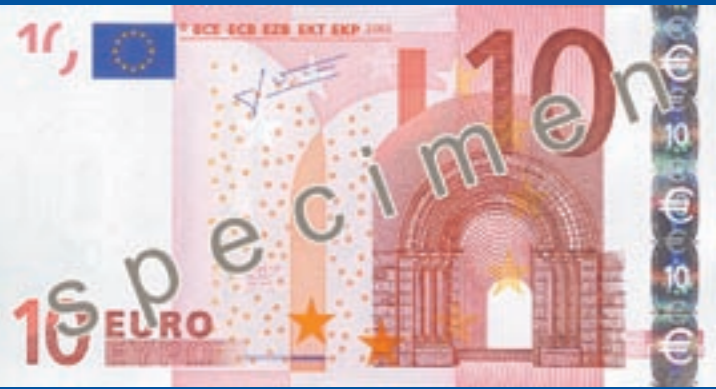
127 x 67 mm, punane