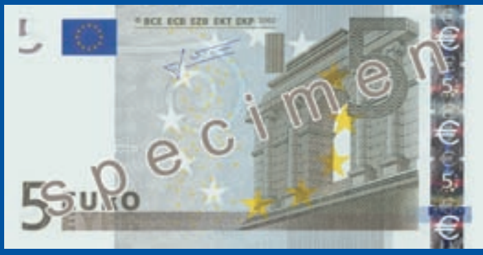
120 x 62 mm, hall