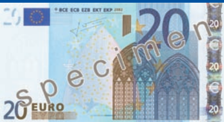
133 x 72 mm, sinine