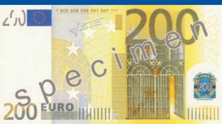
153 x 82 mm, kollakaspruun